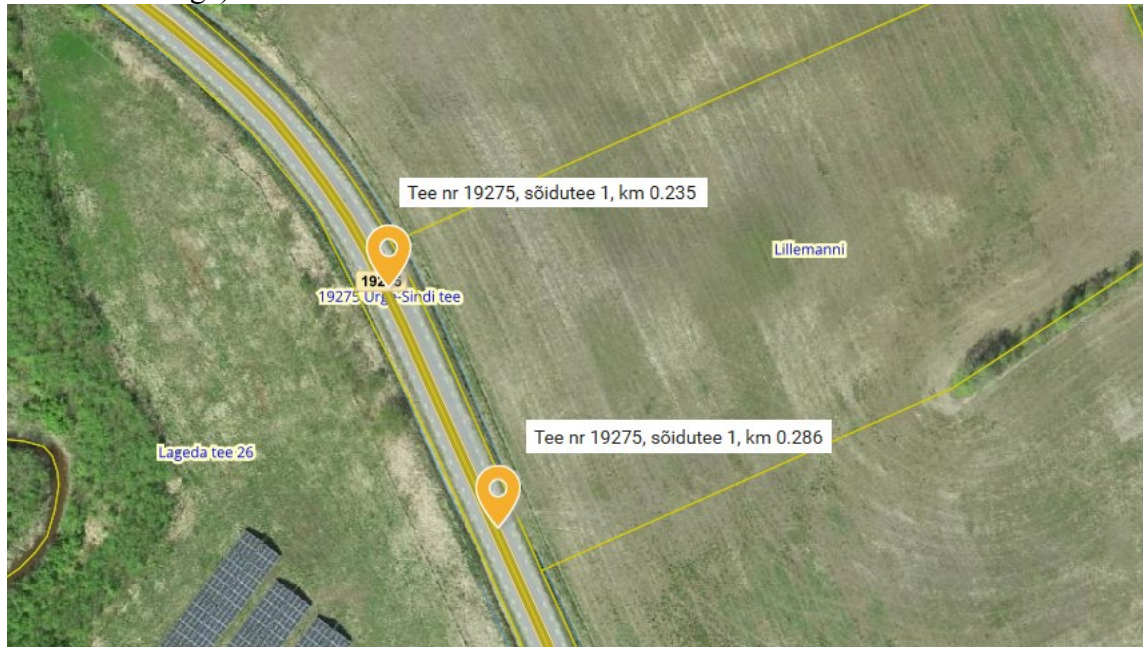
Joonis 1. Ristumiskoha asukohad tähistatud oranži tähisega